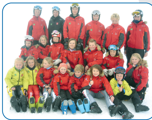
Alpingruppa i Stordal. Ein sprek gjeng også om sommaren.

Rundt 700 ungdomar er i dag involverte i HVU. Kvar veke møtast ungdomar til forskjellige aktivitetar i skog og mark.