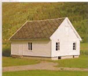
Prestestova er bygd ca. 1850.