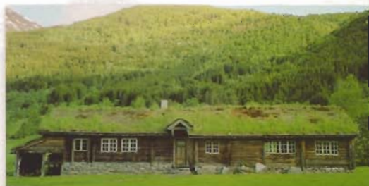
Løsetstova kjem som namnet seier frå garden Løset i Røysetdalen. Dette er ei typisk sunnmørsstove, som vart bygd på 1790-talet.