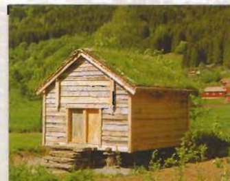
Stabburet kjem frå garden Busengdal og er bygd ca. 1750

Desse to bygningane er eigd av Fortidsminneforeninga.