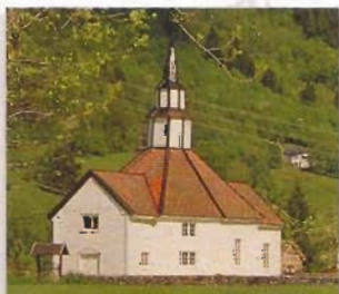
Rosekyrkja frå 1789.