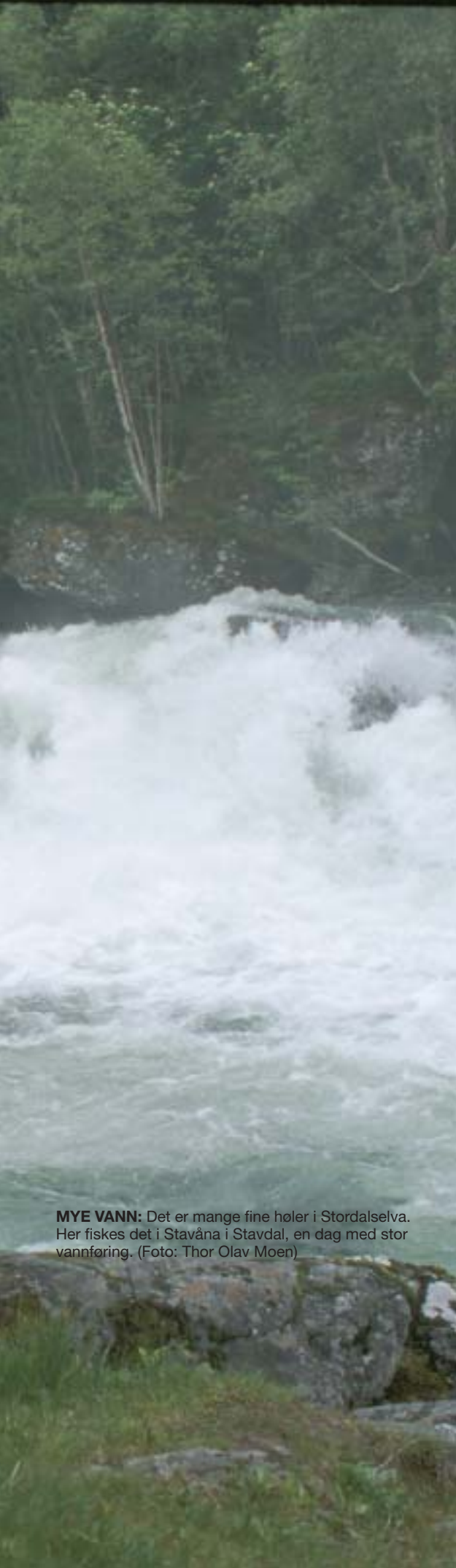
MYE VANN: Det er mange fine høler i Stordalselva. Her fiskes det i Stavåna i Stավdal, en dag med stor vannføring.

N aturskjønt beliggende, greit tilgjengelig for fiskere og i stadig framgang kun med naturens hjelp. Dette er de viktigste stikkordene for Stordalselva. Stordalselva ligger, som navnet indikerer, i bygda Stավdal og renner ut i Stավfjorden på Nordmøre. Elva betegnes som en av de beste lakseelvene på Nord-Vestlandet. De siste sesongene er det tatt over to tonn laks og sjørret.